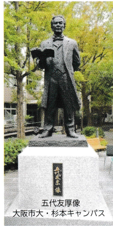
五代友厚像 大阪市大・杉本キャンパス