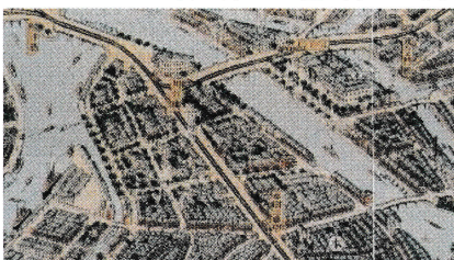
外国人居留地を中心に、右に大阪府庁江之子島庁舎、左に川口運上・大阪港 大阪パノラマ地図復刻版(大正15年)の一部