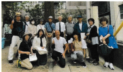
大坂商業講習所跡碑の前で集合写真

最後は大坂商業講習所跡。明治13年(1880)11月に五代友厚が中心となり創設・開所した。現在の大阪市大へと引き継がれている。