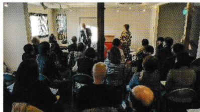
セミナー風景写真

演者含め38名で開催。旧京街道守口宿の古民家を改造した2階の会場。講談に臨場感が深まり、幕末・明治初期にタイムスリッ