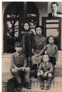
筆者(左)の戦後唯一の家族写真。神戸の自宅のポーチにて 昭和21年(1946)4月超インフレになる直前

米吉郎の長男永見省一(私の外祖父)は、五代友厚の娘武子・藍子姉妹と従姉妹関係にある宮地綾(私の外祖母)と結婚した。綾の父宮地長夫は元姫路藩士で五代の弘成館幹部、播磨大立銀山の鉱長だつた。