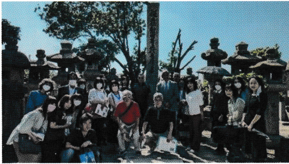
墓参時の集合写真